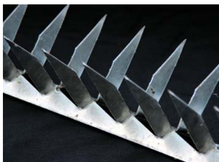
Barreiras duplas de proteção

A Sá Metais oferece toda linha de segurança para residências e condomínios, muito mais tranquilidade para sua casa.